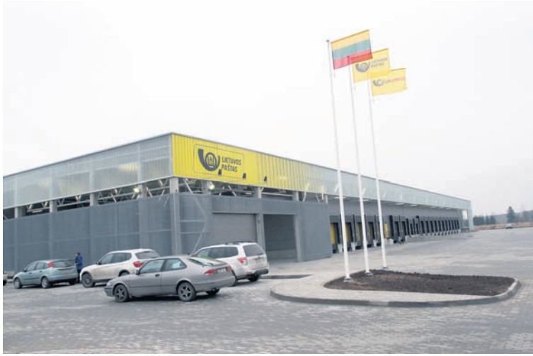
Naujasis logistikos centras visu pajėgumu ims veikti nuo kovo vidurio.